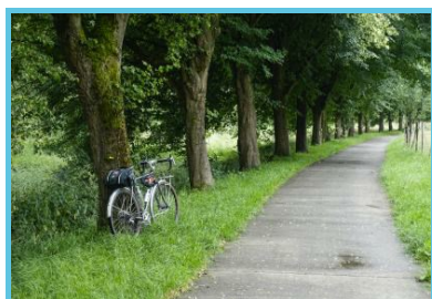
WBT - Hikeup/Railtrip