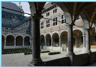
WBT - J.P. Remy